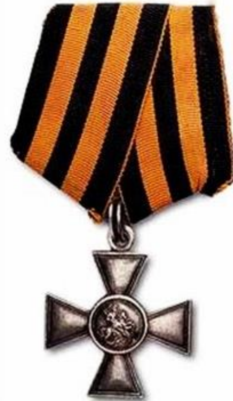
Орден Святого Георгия с Георгиевской лентой (Российская империя)

Исторически «Георгиевская ленточка» является наследницей Георгиевской ленты - двухцветной ленты к ордену Святого Георгия, Георгиевскому кресту или Георгиевской медали, которые служили военными наградами в Российской Империи.